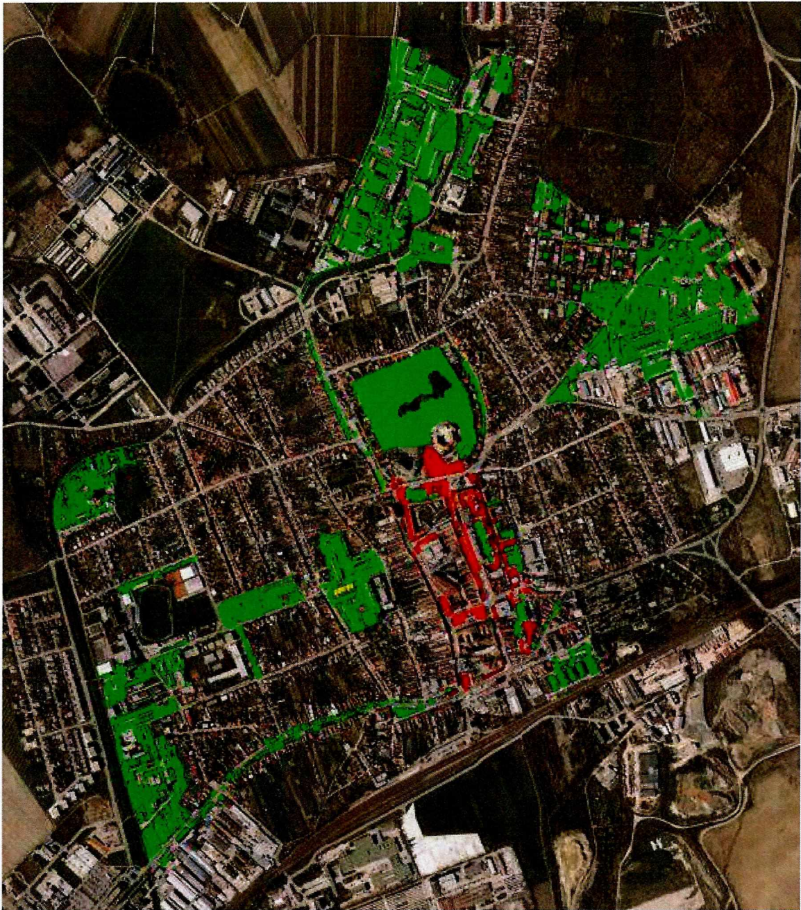
Mapka plôch kosenia