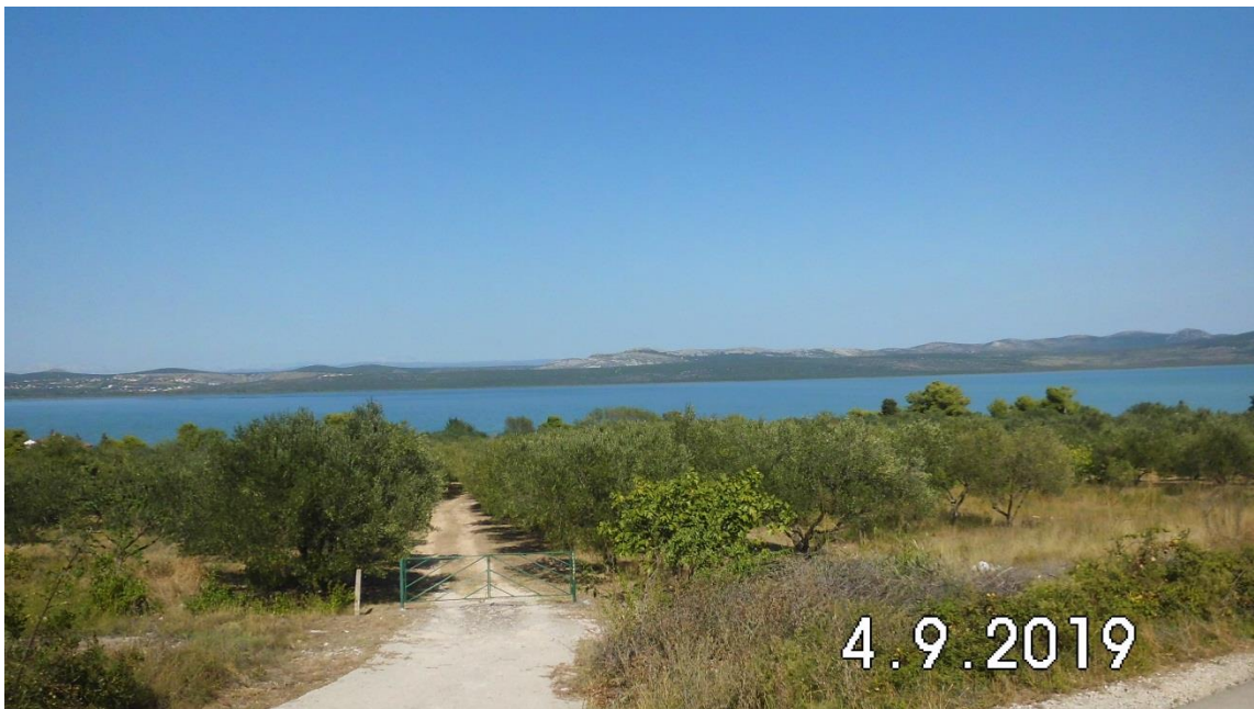
Pohľad zo západnej strany jazera