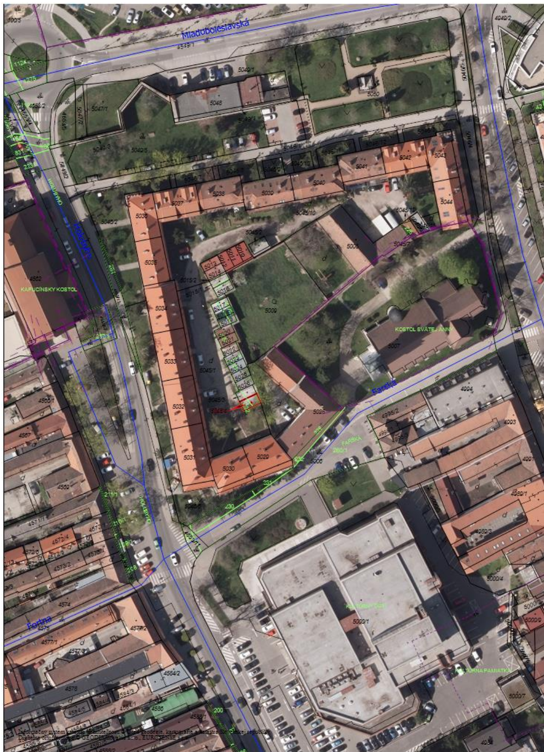
Obr. č. 2: Ortomapa