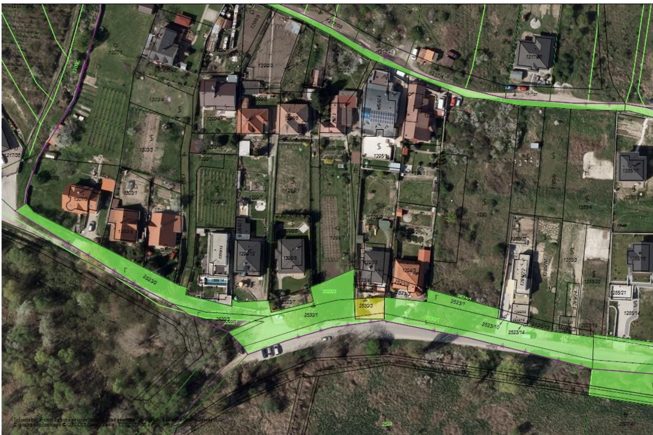
Obr. 02 Orto mapa