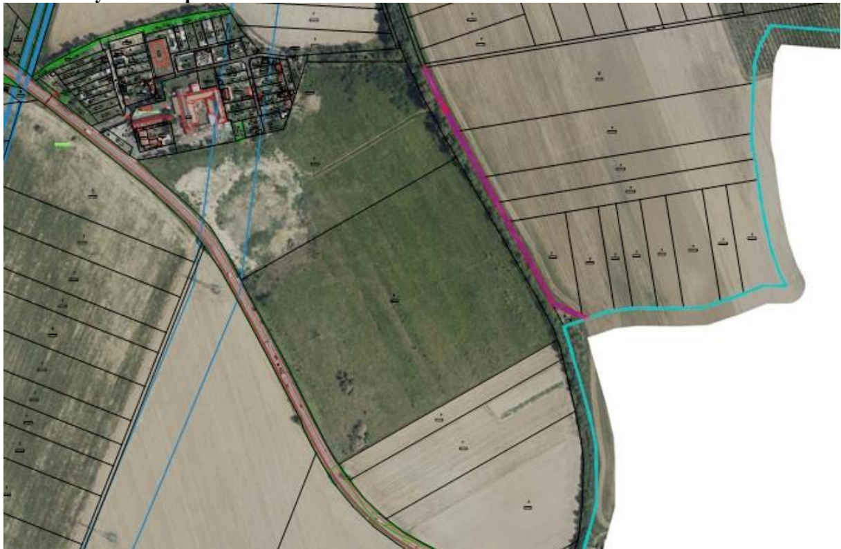
Obr. 1 – Vyznačenie pozemku Mesta